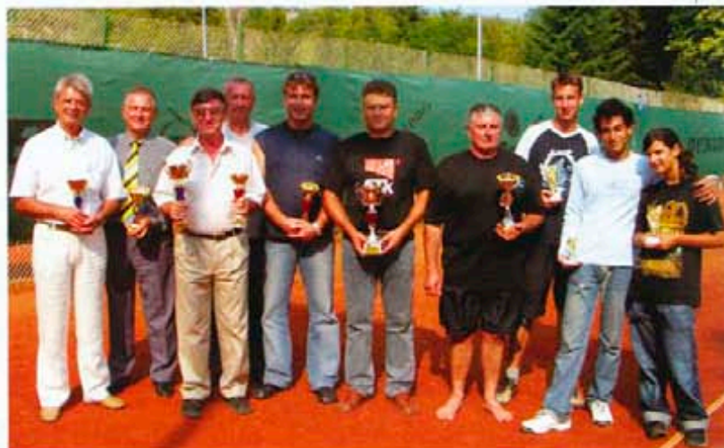
Носителите на купи